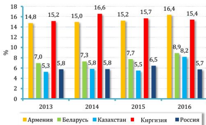
Рис. 2. Импорт услуг стран ЕАЭС (в % к ВВП)

сии наблюдается небольшое снижение с 6,5% в 2015 г. до 5,7% в 2016 г. (рис. 2).