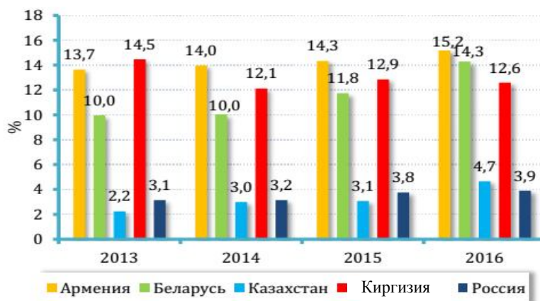
Рис. 1. Экспорт услуг стран ЕАЭС (в % к ВВП)

Анализ динамики экспорта услуг в странах – членах ЕАЭС (рис. 1 1 ) показал, что наибольшая доля у Армении (15,2%), Беларуси (14,3%) и Киргизии (12,6%). Стабильный рост отмечается у Армении (с 14,3% в 2015 г. до 15,2% в 2016 г.), Беларуси (с 11,8% в 2015 г. до 14,3% в 2016 г.) и Казахстана (с 3,1% в 2015 г. до 4,7% в 2016 г.). У России достаточно низкая доля экспорта услуг – 3,9%.