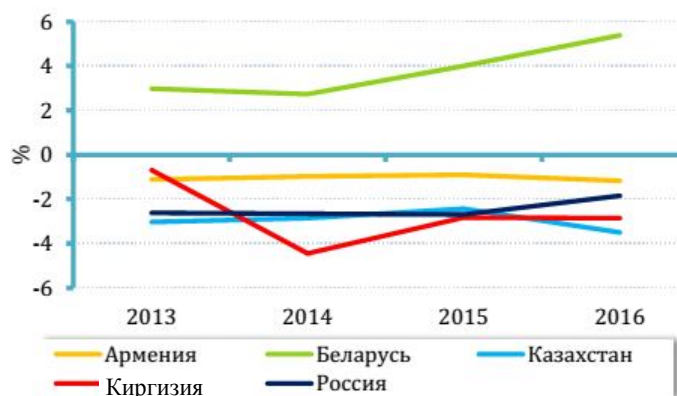
Рис. 3. Сальдо баланса услуг стран ЕАЭС (в % к ВВП)

Для внешней торговли услугами стран ЕАЭС (Киргизия, Казахстан, Армения, Россия) характерно отрицательное сальдо торгового баланса (рис. 3).