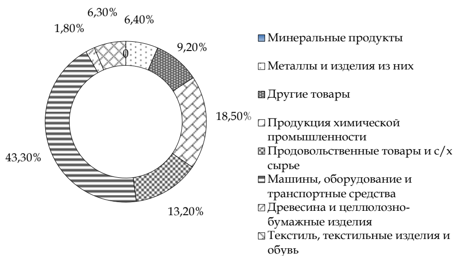
Рис. 2. Структура импорта стран ЕАЭС в 2016 г. (в %)

Структура экспорта и импорта товаров во внешней торговле за январь – декабрь 2016 г. (в процентах к итогу) показана на рис. 2 и 3.