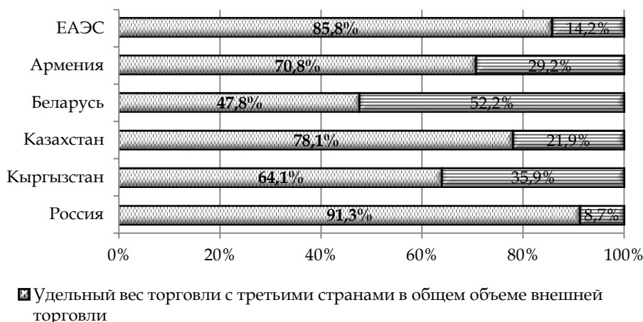
Рис. 4. Удельный вес взаимной торговли в общем объеме внешней торговли по ЕАЭС в целом и по государствам – членам ЕАЭС в отдельности в 2016 г.

Удельный вес взаимной торговли в январе 2017 г. по сравнению с январем – декабрем 2015 г. в общем объеме внешней торговли по ЕАЭС увеличился с 13,6 до 14,2%. В товарной структуре взаимной торговли государств – членов ЕАЭС наибольший удельный вес занимают минеральные продукты (27,1% объема взаимной торговли), из которых 85% на рынок ЕАЭС поставляет Российская Федерация. Существенны поставки машин, оборудования и транспортных средств (17,5% объема взаимной торговли, из которых 54,7% приходится на Российскую Федерацию и 41,9% – на Республику Беларусь). Доля продовольственных товаров и сельскохозяйственного сырья составила 16,1% объема взаимной торговли, из которых 52,5% приходится на Республику Беларусь и 35,9% – на Российскую Федерацию. Данные об удельном весе взаимной торговли в общем объеме внешней торговли по ЕАЭС в целом и по государствам – членам ЕАЭС в отдельности за январь – декабрь 2016 г. представлены на рис. 4.