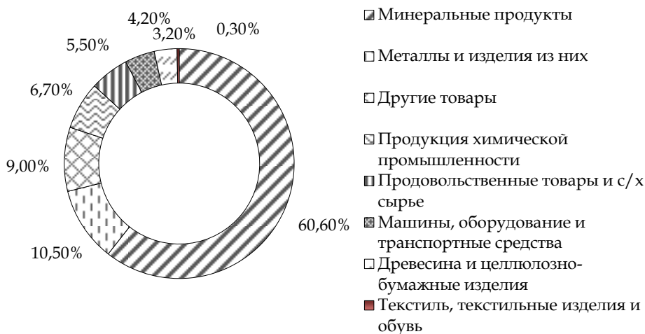
Рис. 3. Структура экспорта стран ЕАЭС в 2016 г. (в %)