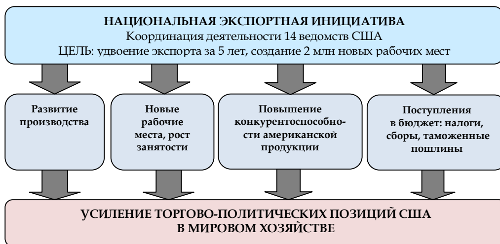
Рис. 1. Системные цели реализации Национальной экспортной инициативы

Одним из ключевых элементов антикризисных планов стала разработанная Национальная экспортная инициатива, которая была законодательно оформлена Указом Президента США 27 января 2010 г. (рис. 1 1 ).